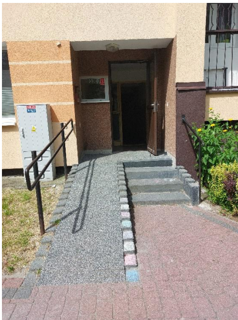
Fot. 4. Wejście do budynku.