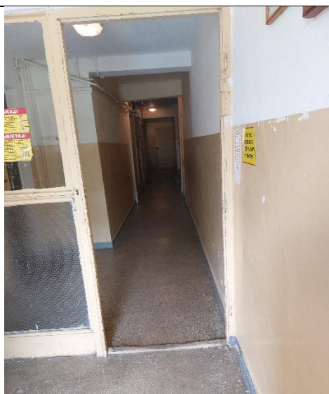
Fot. 6. Dojście do klatki chodowej.