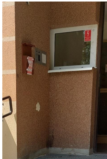
Fot. 5. Umiejscowienie domofonu.