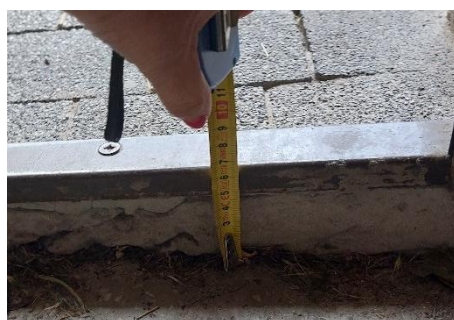
Fot. 7. Wysokość progu wejściowego.