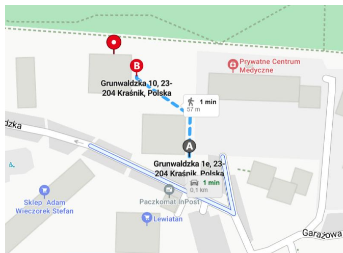
Rysunek 1. Dojście z budynku do altany śmietnikowej.